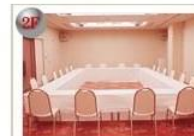
網笠の間 107.74m 2