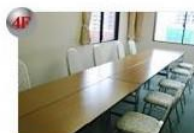
401号小会議室 29.86m 2