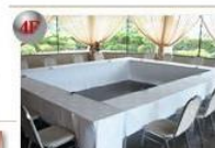
グラバーの間 70.23m 2